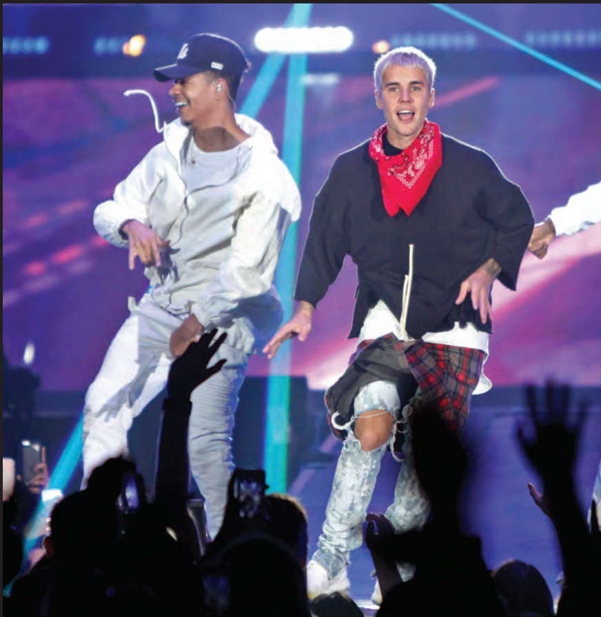
Justin Bieber Purpose Tour | Prudential Center