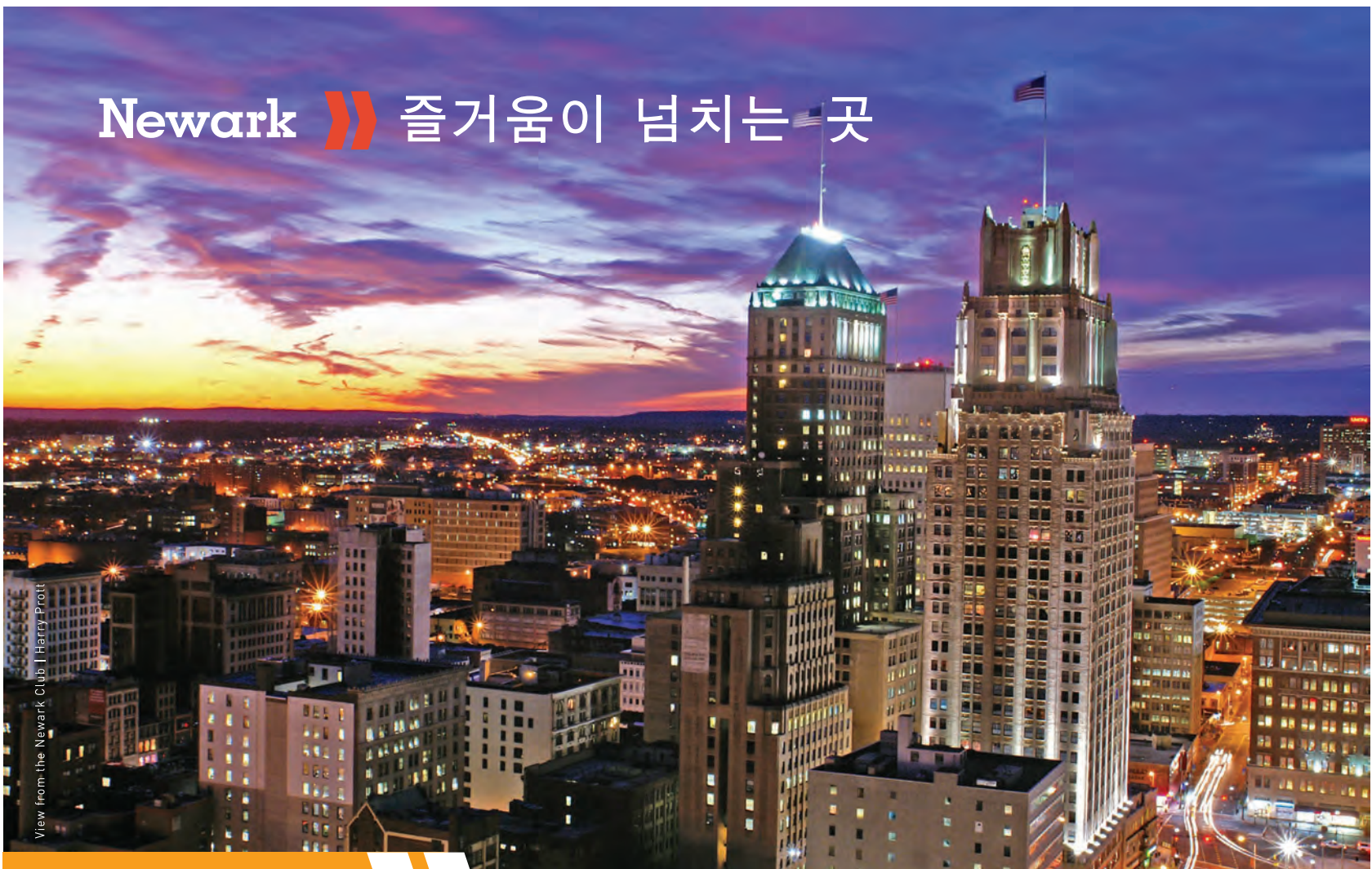
View from the Newark Club | Harry Prott